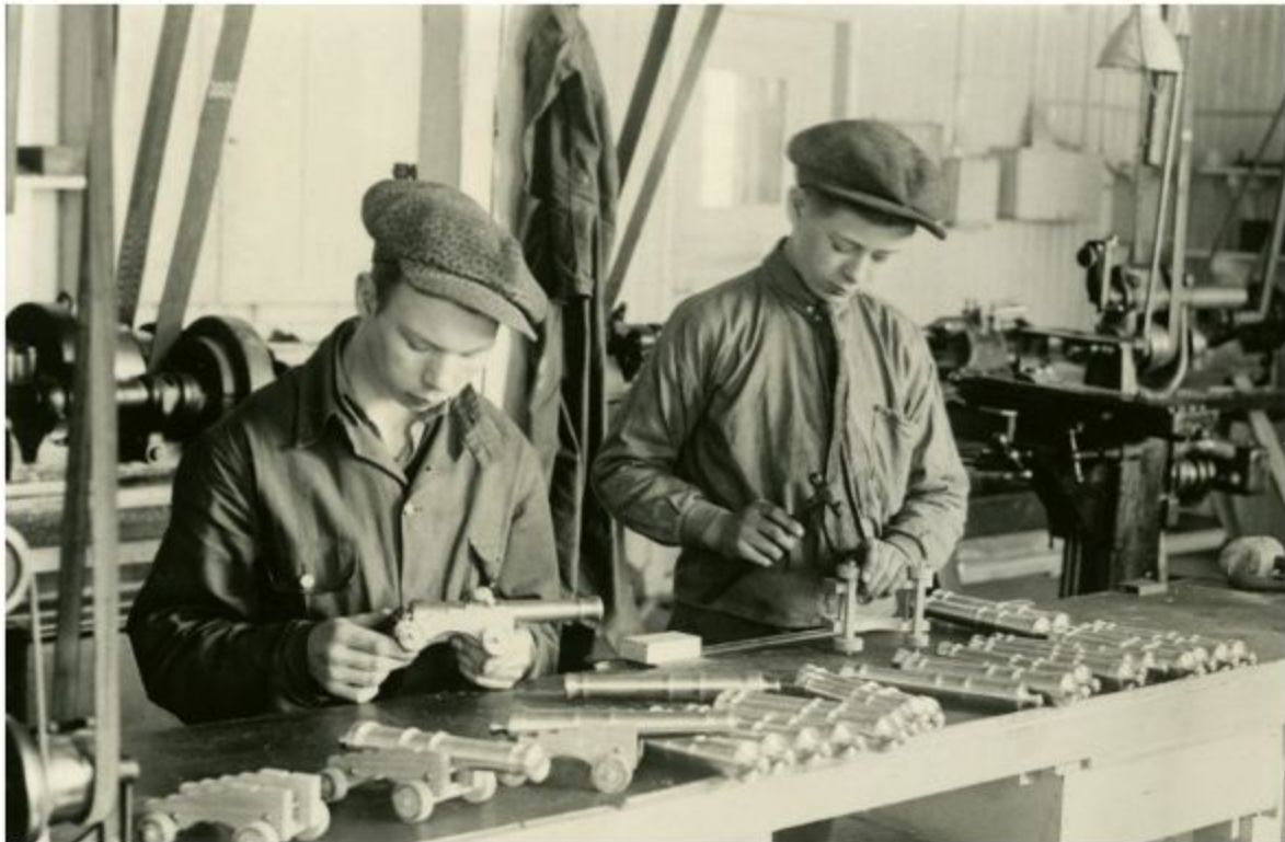
Här ser vi ett par män färdigställa modell av skeppet samt ett par grabbar som monterar kanoner till modellbygget, mars 1931.